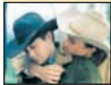
Les cow-boys gay, c'est pas nouveau.