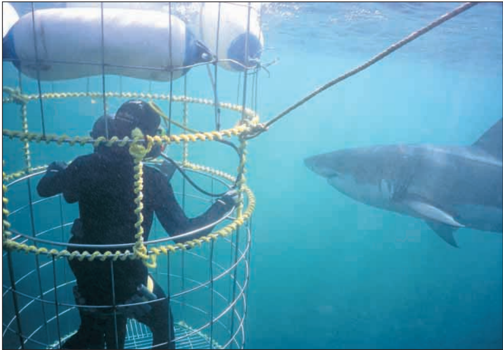
Soudain, la masse surgit de nulle part et frôle la cage...