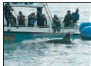
La plongée en cage est devenue un commerce juteux.

«Ils ne sont donc pas protégés la plupart du temps.» Ramon Bonfil insiste: «Il faut une protection internationale. Le requin est en danger d'extinction.» Il a d'ailleurs été inscrit en mai 2004 sur la liste des espèces vulnérables. TJ